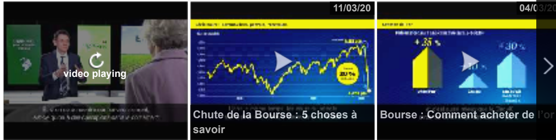
Video Smart Player invented by Digiteka